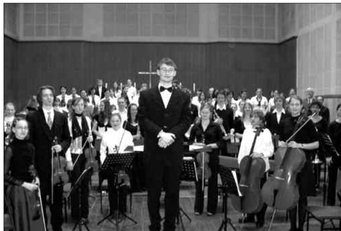
Das ensemble interregio 2008 nach dem Konzert in der Lukaskirche Dresden

Nachdem im Vorjahr das Probenlager den Chören vorbehalten war und über 50 Kinder auf eine musikalische Weltreise gingen, soll in diesem Jahr ausschließlich Orchestermusik einstudiert werden. Als künstlerischen Leiter konnte Cornelius Volke gewonnen werden.