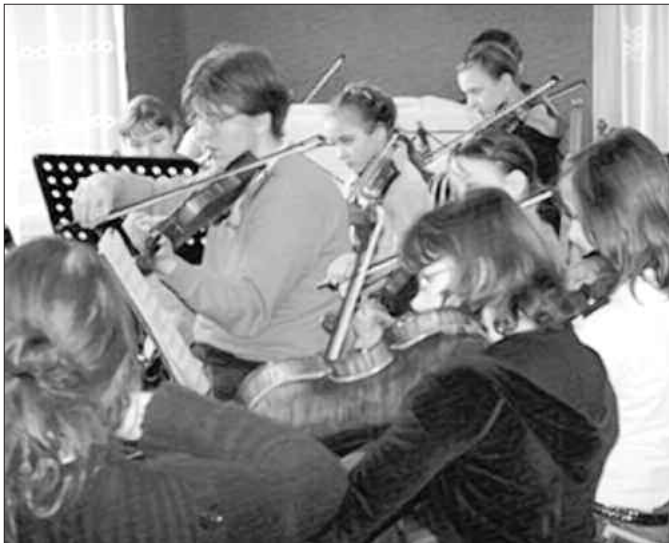
Ein besonderes Orchester: Musikschüler aus Tschechien, Polen und Deutschland treffen sich und musizieren gemeinsam