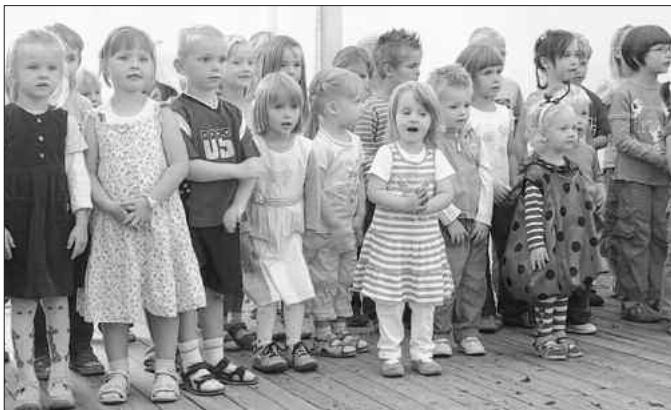
Ihren ersten großen Auftritt vor ganz viel Publikum erlebten die Kinder aus dem Hänichener Kindergarten.

Die Hänichener Feuerwehr begeht jedes Jahr Ende August ihren traditionellen Tag der offenen Tür. Dabei können sie auf die Unterstützung des Ortschaftsrates Rippien und seit einigen Jahren auch auf die der Straßengemeinschaft Querweg 4 bauen. Aus dieser Zusammenarbeit ergab sich das große Dorffest 2005, das super angekommen war. Nun gab es am vergangenen Wochenende eine erneute Auflage. Die rührigen Organisatoren hatten sich langfristig wieder eine Menge einfallen lassen und man kann es gleich vorweg nehmen, auch diesmal wurde das Fest ein voller Erfolg.